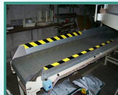
Bestaande vlakke band omgebouwd naar een vlakke band met een weegplateau erin gemonteerd.

Bekijk voor een impressie de video op onze website.