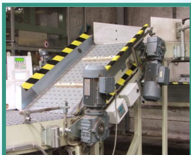
Bestaande opvoerband omgebouwd naar een wegende opvoerband.